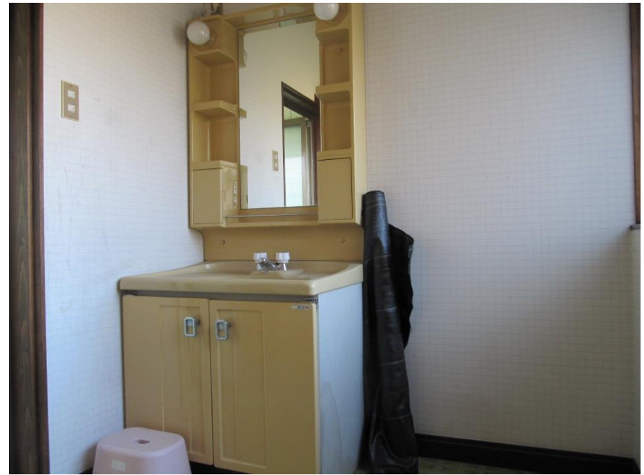
内観(1階洗面・手洗)