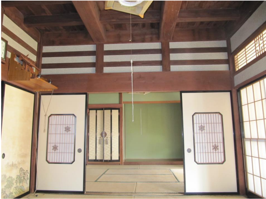
内観(1階和室:8帖、枠の内造り)